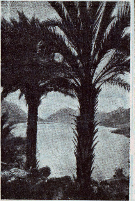
Udsigt over Comosøen.

For ikke at komme paa Afveje brød vi af og fulgte Vejen gennem Bjergpasset. — Længe laa vi heroppe og saa ned over Søen, i hvis krystalklare Vand Bjergene spejler sig. Hvilken Farvepragt, hvilke Nuancer!