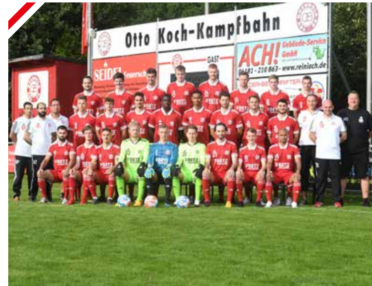
UNSERE MANNSCHAFT UND DAS TRAINERTeam · SAISON 2021/2022